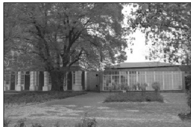
Die heute noch stehende Orangerie am Schlossgartensalon Merseburg

Anmeldungen, davon 163 Neuanmeldungen (Stand 23. November 2005). Die Wohnsitzprämie kann jährlich beantragt werden. Anträge gibt es im Einwohnermeldeamt, Siegfried-Berger-Straße 5-7 oder unter www.merseburg.de , Rubrik: Bildung/Hochschule Merseburg.