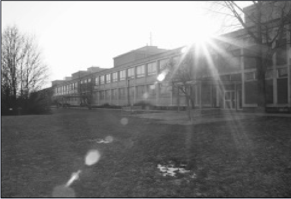
Ausweichquartier Gebäude 132: Noch stehen sie leer, die renovierten und mit notwendiger Infrastruktur versehenen Räume, aber schon in den nächsten Tagen zieht hier Leben ein.

Mit Beginn dieses Kalenderjahres beginnen nun auch auf dem Campus der Hochschule Merseburg (FH) die umfangreichen Sanierungsarbeiten. Der Bauablaufplan mit Baubeginn und Bauende sowie die Architekturpläne wurden im Intranet veröffentlicht. So kann sich jedes Mitglied der Hochschule darüber informieren, wann „sein“ Gebäude saniert wird.