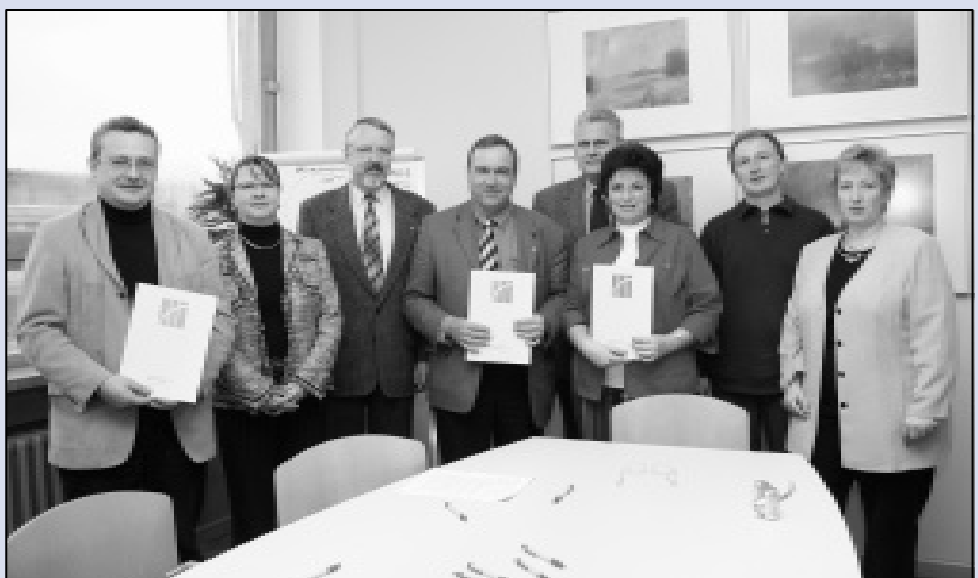
Nach Unterzeichnung der dreiseitigen Kooperationsvereinbarung in den Räumen des Rektorates der Hochschule Merseburg (FH).

Der neue Kooperationspartner im Internet www.romonta.de