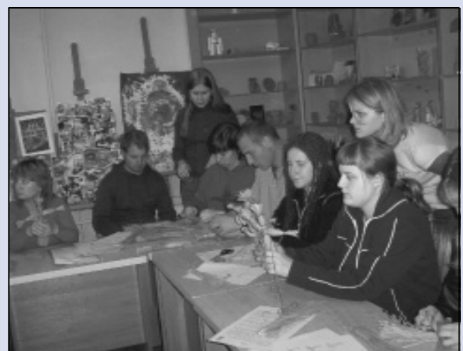
Beim deutsch-russischen Puppenbauworkshop Herbst 2005 in Wolgograd.